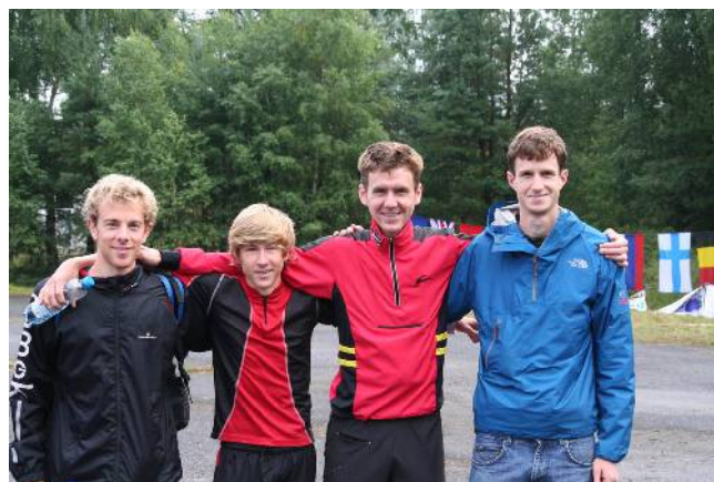
Een selectie hammers...

Als dit zo zou blijven tot de jachtstart van de laatste dag, beloofde het spannend te worden, maar met maar 1 van de 5 wedstrijden ervoor gelopen, zegt het natuurlijk niks.