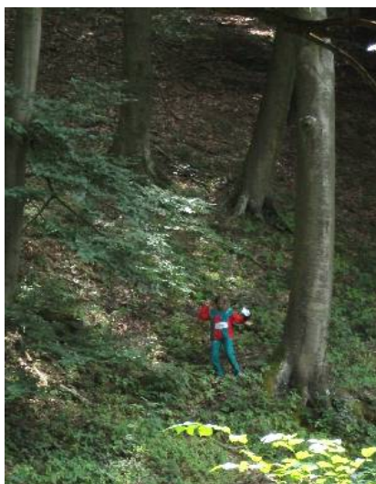
Roxanne daalt af