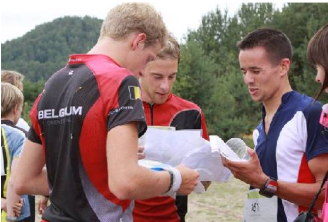
Kaartbespreking na de jachtstart

kwijt. Ook uw dienaar bleef niet foutloos, zodat er op een derde wedstrijd aan een lusje gelegenheid was voor de achtervolgers om het verschil te meten. 2min45 was nog comfortabel, zelfs met de terril en de legendarisch slechte daalsnelheid in het achterhoofd. Uiteindelijk was het verschil aan de meet nog zo'n twee minuten op Yannick. Die werd makkelijk tweede omdat Desmond de sprint niet wou afwachten en in de laatste groene zone voor de directe route koos in plaats van het paadje rond te nemen. Verloor daar tijd en moest zo genoeg nemen met een derde plaats.