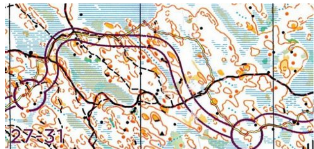
Corridor: zo moet het niet