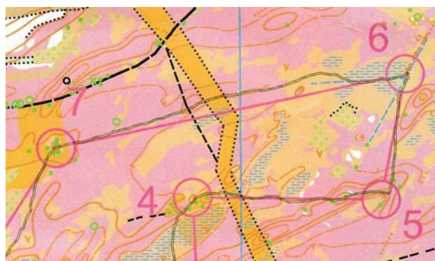
Heidelusje op Masy

Op een kaart die relatief goed in orde was, op een detail hier en daar na, was het plezant lopen. Niet al te moeilijk gedurende het langste deel van de wedstrijd, maar af en toe was wel wat oplettendheid nodig om de juiste put te vinden.