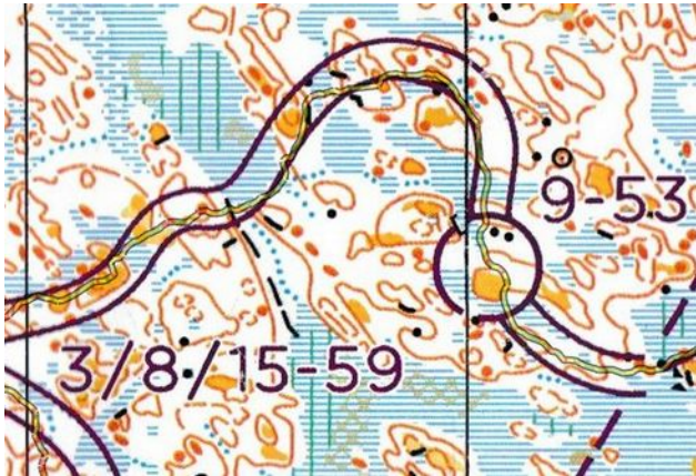
Corridor: zo moet het wel

En dan was achter in het bos. Dan maar een paar stukjes over laten voor een volgende keer. Gelukkig bleek de meerderheid in een soortgelijke situatie te zitten. Die volgende keer kwam al snel, want diezelfde namiddag al kon er revanche op de kaart genomen worden. Diegenen die meer vertrouwen wilden tanken, gingen terug naar de kaart van gisteren.