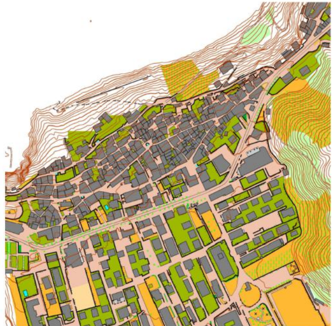
Extract uit mijn zelfgetekende kaart waar ik heel veel simulaties op heb uitgevoerd