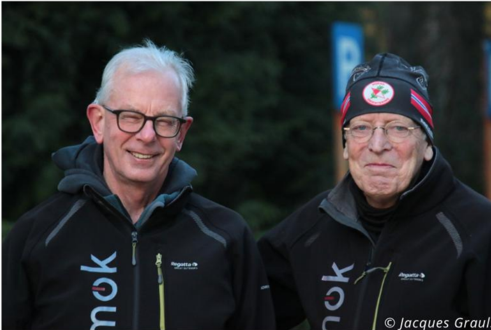
Men in Black

Zonet van de redacteur van de Knijptang gehoord dat we ondertussen weer 4 jaar bezig zijn met de uitgave van de Knijptang in de vorm die we elke maand in de bus krijgen of digitaal lezen. De Knijptang versie 2.0 die gestart is na Corona biedt ongelooflijk interessante verhalen op. Een mooie lay-out, de nodige foto's om het geheel wat op te vrolijken. Dus een grote dank aan Filip en al zijn medeschrijvers. We kijken al uit naar het begin van de maand en de volgende editie van de Knijptang.