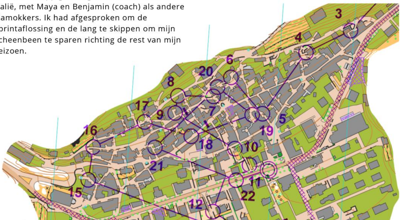
JWOC Sprint 2025