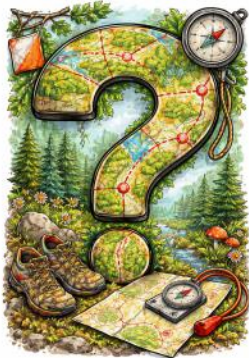
Gouden Balise Wordt onthuld op het clubfeest