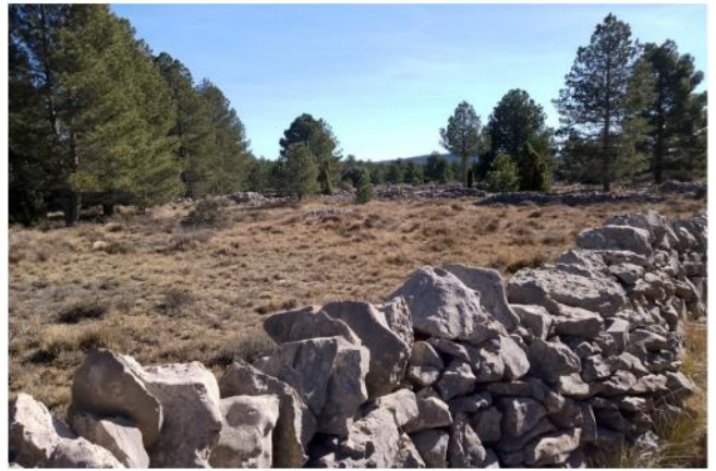
De muurtjes op dag 1

Als fervent volger van 'de koers' krijg ik die middag nog een verrassing. De Ronde van Valencia komt hier vlakbij langs vandaag. Dus zet ik me in de berm en zie UAE op kop van het klein peloton de gele leiderstrui van João Almeida verdedigen. Een twintigtal kilometers verder moet-ie 'm toch definitief afstaan aan Bahrein-Victorious coureur Santiago Buitrago.