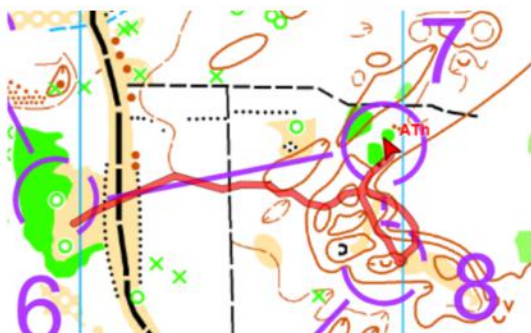
Amber richting post 7

Haar oriëntatieskills op de rest van de omloop waren van uitzonderlijk niveau, een klasse apart. Deze prestatie laat niet alleen zien dat leeftijd geen vat op haar heeft, maar ook haar pure kwaliteit als nachtorienteur.