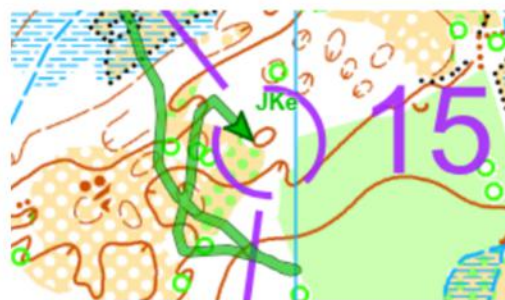
Jorn richting post 15

Jorn Kennis liep een bijna perfecte wedstrijd en bleef tot post 15 in het spoor van de razendsnelle Mats De Smul. Helaas kostten twee missers bij post 15 en 17 – samen goed voor 5 minuten tijdverlies – hem de kans om nog dichterbij de overwinning te komen. Desondanks hield hij stand en finishte in 43:03, goed voor een sterke tweede plaats. De Smul, die slechts vier seconden per kilometer trager liep dan de snelste tijd bij de Heren Elite, bleek uiteindelijk onhoudbaar. Toch bewees Jorn opnieuw dat hij tot de absolute top in zijn categorie behoort.