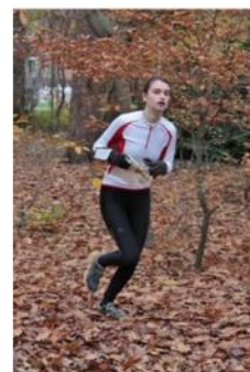
City Cup D40