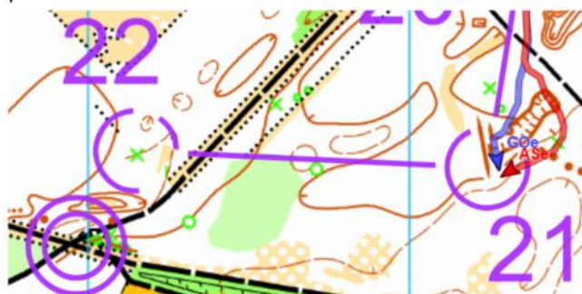
Duel tussen Greet (blauw) en Anna (rood)

Greet Oeyen liep een ijzersterke race en hield lange tijd de leiding in handen. Zelfs aan de voorlaatste post hield ze nog gelijke tred met de 10 jaar jongere Anna Serralonga. Maar uiteindelijk moest ze met slechts 26 seconden verschil genoeg nemen met de tweede plaats.