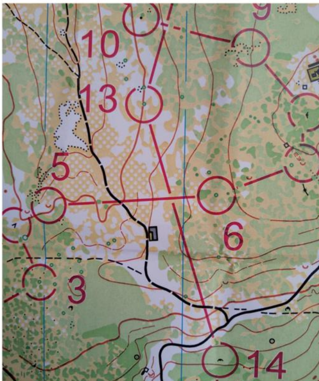
Kaart, dag 2

En ze zijn met velen. Ze zijn met zeer velen. Het komt er gewoon op neer de juiste amigos te kiezen. Het is niet zo dat ik nu door het landschap vlieg, maar ik heb er kop-en-staart aan gekregen. De snelheid is overigens zeer laag. Die puntige stenen liggen niet alleen opgestapeld in muurtjes maar ook op de gehele ondergrond. En ik weet uit ervaring wat een misstap kan betekenen. Het is een hele uitdaging geworden, maar we zijn er geraakt.