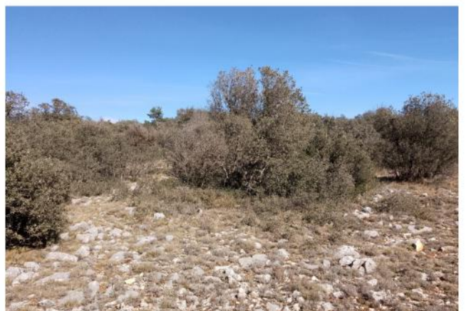
Het landschap op dag 2