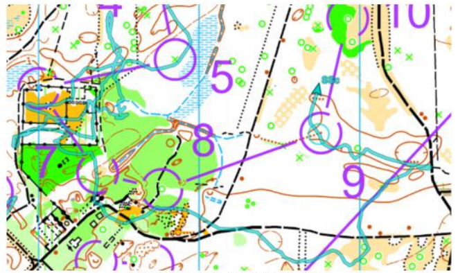
Stefaan rond post 7 en 9

Toch hielden ze stand in een sterk bezette elitereeks, met een verdienstelijke 5e en 7e plaats als resultaat. Prestaties waar de schrijver van dit artikel enkel van kan dromen: Thomas van der Kleij staakte zijn wedstrijd bij post 10 met een kuitblessure.