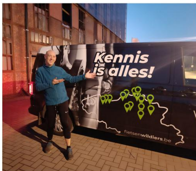
Dit kon ik gewoonweg niet laten 😊

En dan valt er plots een tekstje van Peter in mijn mailbox over zijn avonturen met stenen muurtjes. "Ik kon het niet laten" schreef hij nog, terwijl ik enkel dacht "wat fijn zo'n spontaan en top geschreven tekstje". Dankjewel.