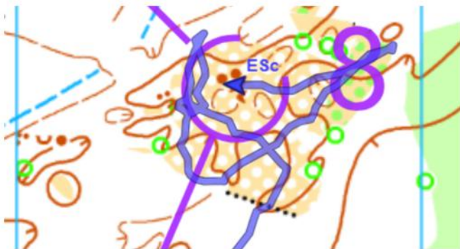
Elisabeth richting post 8

Elisabeth Schutjes liep een sterke wedstrijd, maar een fout bij post 8 kostte haar vijf kostbare minuten. Uiteindelijk strandde ze op de derde plaats in 59:30, net geen aansluiting meer vindend bij de strijd om zilver. Met slechts 4:53 achterstand op de winnares Ellen Bourgonjon had er meer ingezet, maar haar podiumplaats blijft een mooie bevestiging van haar niveau.