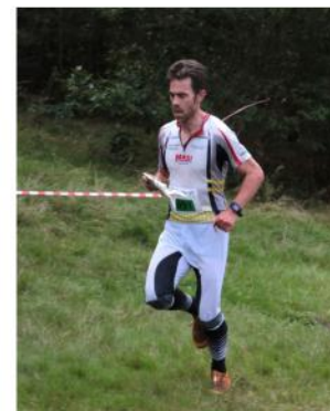
BK aflossing DMA

Hij doet het zuinig en sporadisch Maar van de Rik Thys krijgt hij erecties met de kroost vaak glunderend op instagram en met de micro ook niet verlegen om wat gezwam hij toont hoe je het moet doen: VAN DER KLEIJ ... JEROEN