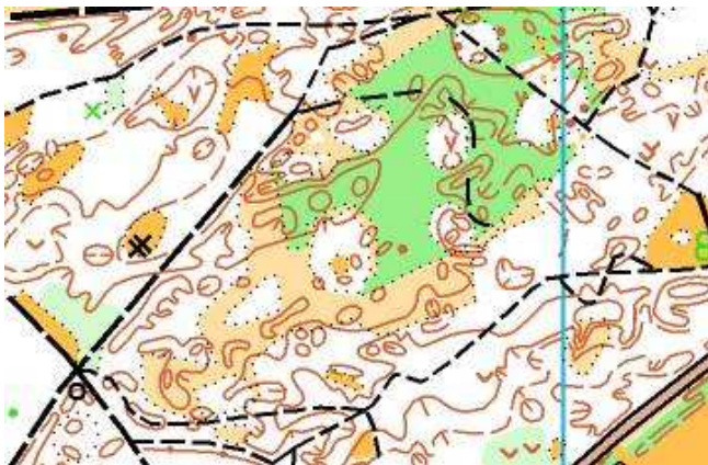
Kaartfragment Kattenbos - Noord