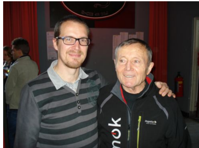
De nieuwe en de vorige secretaris