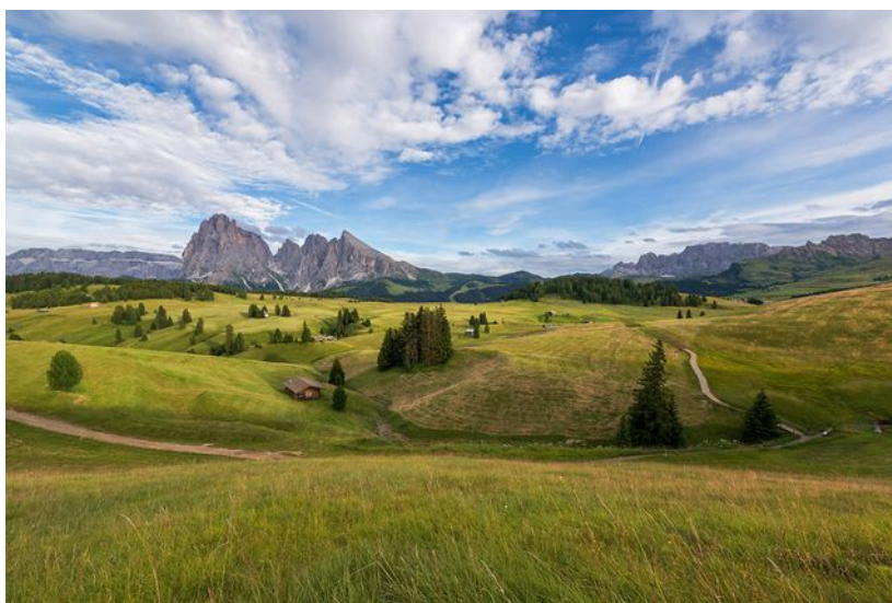
Seiseralm ( CC BY 4.0 )