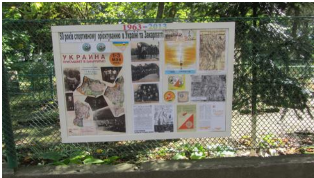
De eerste O-kaart in de omgeving van Uzhgorod en 50 jaar geleden

De sprint werd gelopen aan de overkant van de Uzh en daar kwamen we terecht in het schilderachtige decor van een middeneuropese stad met fraaie pleintjes, steegjes en heel veel kleurig volk. Onbewust drementelden we door de sprintkaart, kocht Wim zich een paar trailschoenen (35 €) omdat zijn zolen eruit zagen als de stedelijke zijstraten en kreeg een winkelmadam van een volgestouwd straatstalletje haast een hartstilstand bij het zien van een ontiegelijk grote geldflap (Hryvnia) voor