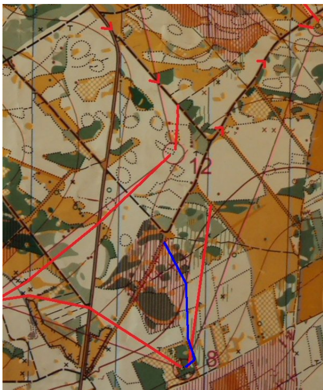
Verboden zone naar post 9