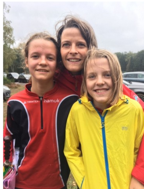
De vrouwen verloren