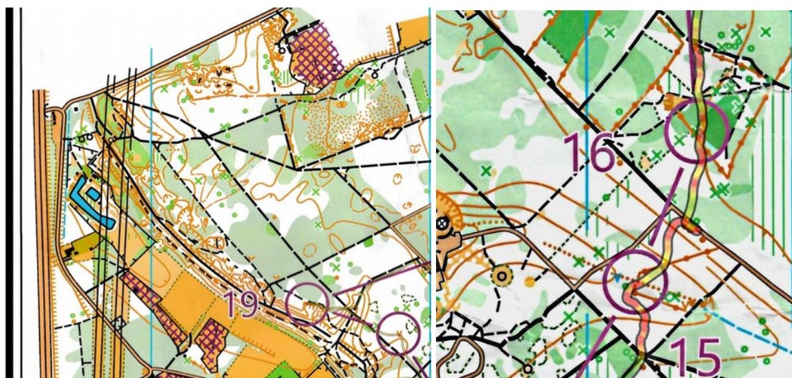
De technische zone

Nu, vergeleken met deze wedstrijd was het BK Lang een week eerder, zonder noorderlijnen, was dit een hoogmis voor de sport: niks plezanters dan in een massastart tegen de stroom in lopen, optimaal gebruik van de technische zones, goede vegetaties, kaarten voor iedereen en posten die haarfijn juist staan.