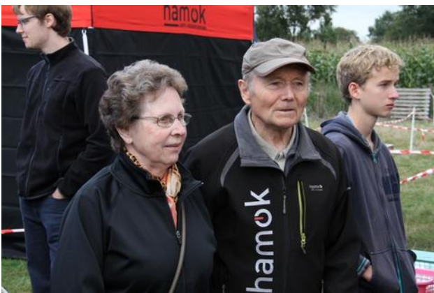
Roza was het regelmatigste