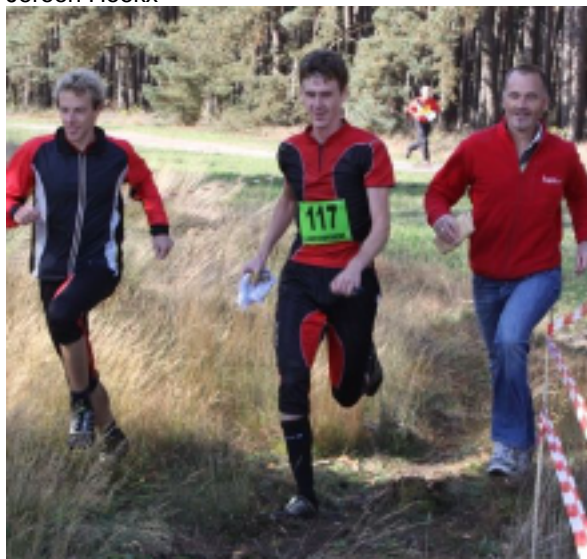
Met grootse allure in de snitsel