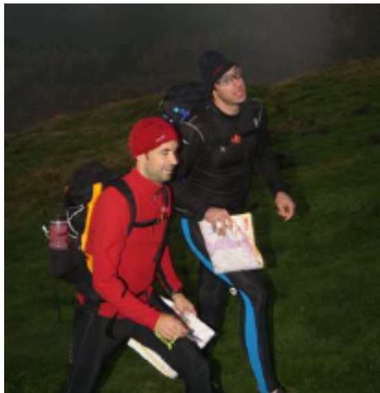
Early in the morning: 70 km en 2600 hoogtemeters voor de boeg

Nog een kwartiertje naar de start stappen, en ruim op tijd. Met de nodige zenuwen kregen we om 8.06 onze kaart overhandigd, en off we were!!