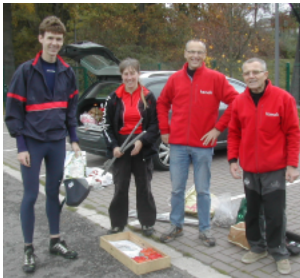
Een multidisciplinair team: postenophaler, mental coach, baanlegger en medaillegrossier.