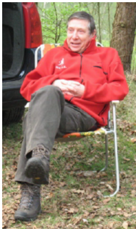
De 'Paashaas' rust even uit.