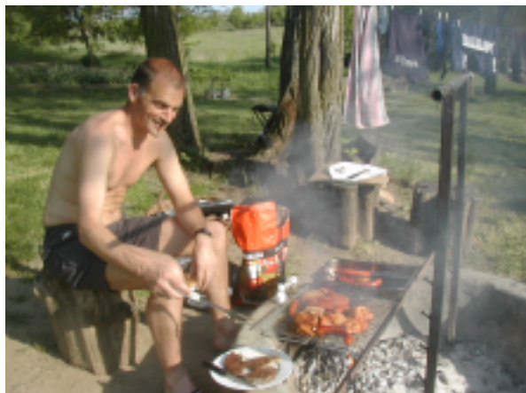
Braaien op de Hongaarse poesta