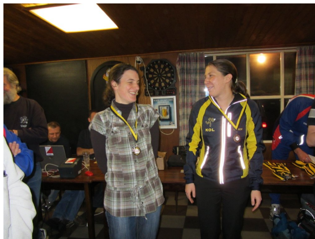
Oeyen heeft de medaille beet

weer uitgetrokken, vreemdsoortige hoofddeksels op- en afgezet, om dan, een kwartier later dan voorzien, het hol van pluto in te duiken.