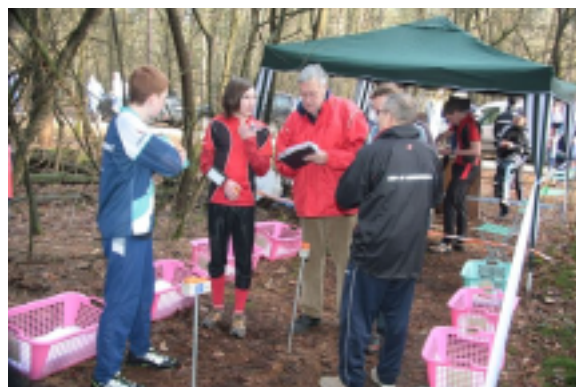
Een goede start van het nieuwe seizoen!