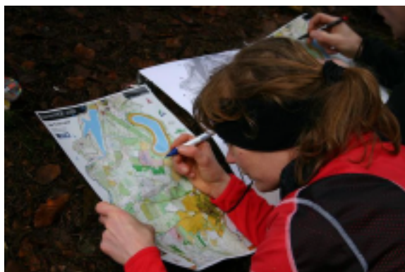
Zo begin je aan de Karrim'hoc!