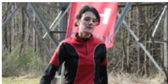
Zag Greet Oeyen toen de bui van 22" al hangen?