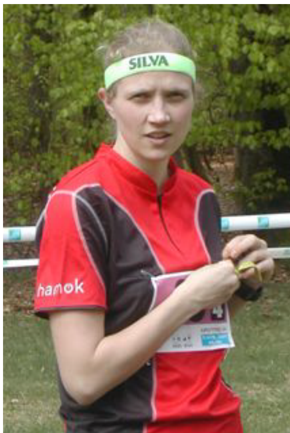
Na de BBQ-Bart breekt nu het tijdperk BBQ-Sofie aan.

baanleggers: Toon Melis en Frederik Meynen computer: Bart Herremans