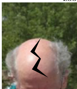
Hoofd van de knijper, dat zich breekt over de toekomst van 'De knijptang' na de vrij eenzame vergadering in het casino van Beringen.