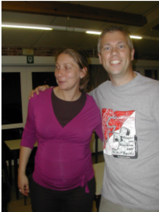
BBQ-manitoe Bart moest aandacht verdelen over hamokkrijgertjes en squaw