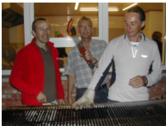
Drie 'mannen' en zwaaien met één worstje!

De organisatie speurt nog altijd naar de Cola-light verslaafde oriënteur die die warme zomeravond 28 (achtentwintig) literflessen soldaat maakte - en al zwevend over de Genemeerbossen ontsnapte aan de grijpgrage handen van de toogverantwoordelijke. Het was ook een 'light' versie van de Finse Aflossing want 22 ploegen is van het goede eigenlijk een beetje te weinig. Meer dan het dubbele zou het gemiddelde nauwelijks evenaren. Nochtans, wat is er mooier om een zomervakantie in te zetten dan een geestige ploegencross mét degoustatie achteraf?