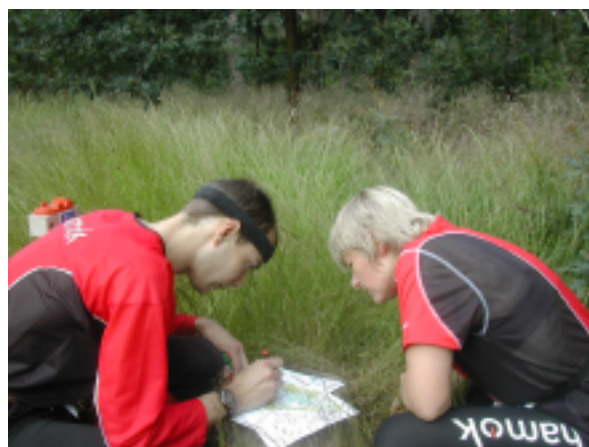
't prieeltje ontbreekt hier