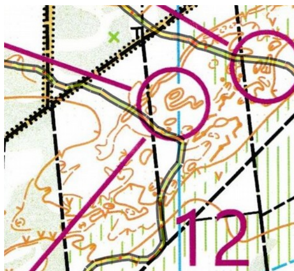
Sommigen lopen recht op foute posten

De 4 e dag op Koersel Fonteintje had alles in zich om richting dag 3 te gaan qua oriëntatiegenot. Toch was het een halve wedstrijd sakkeren na te moeten zoeken naar posten die compleet verkeerd stonden. Dat is het meest elementaire aspect van het oriëntatielopen, zelfs belangrijker dan een kaart die al dan niet juist is.