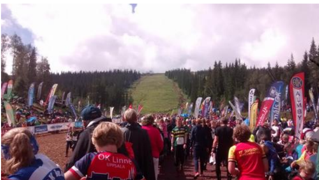
De mensenmassa komt de skipiste af, 5 uur lang

Ondanks de 19 999 andere lopers kom je onderweg toch in zones waarbij je denkt. Ik ben hier precies als enige aan het lopen. Dat is het goede gevoel. Volledig gefocust op de eigen wedstrijd.