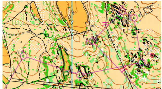
Dag 1: open terrein

gemaakt. Bleek dat het eliteparcours gewoon de H21omloop was, maar met een extra lus op het einde. Toch splitsten we op. Thomas vloog een pad op, uw dienaar dacht door een weide te gaan. Maar in plaats van weide kwam er hoog gras. In plaats van 5 meter lichtgroen kwam er een muur van rotsen en donker groen bos. Toen we daar 3 minuten later door geraakt waren was Thomas ver gaan vliegen. Aan de aankomst was het dan ook vreemd dat Thomas niet snel na mij binnen kwam. Hij bleek een kwartier gesukkeld te hebben in een volgende groene rotszone!