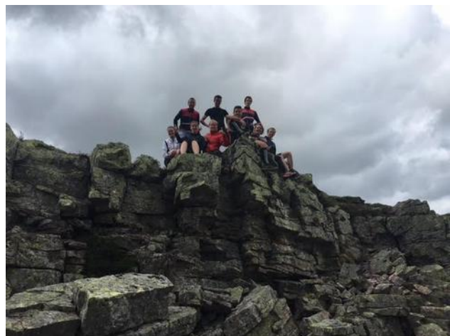
Ja, er zijn te veel Trolvestjes in onze groep

Daarna wordt teruggewandeld naar de bussen, niet meer dan 5 minuten gewacht op het volgende konvooi en zit het sportieve gedeelte van de dag er weer op.