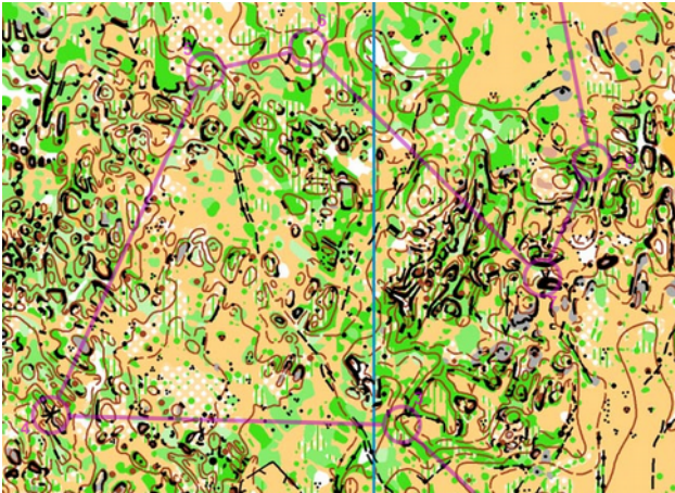
Dag 4 : jungle!

Na de rustdag kwam dag vier. Terug een middle. Dit keer op een andere kaart. Gedaan met de weidse vlaktes en af en toe wat lastige rotsen. Dit keer was het van de ene begroeiing naar de volgende, met een rots er tussenin. Wij waren goed bezig tot we van post 12 naar 13 de voorzitter tegen kwamen, aan wie wij bevestigden dat hij zat waar hij dacht dat hij zat. Dat moment van concentratieverlies kwam ons duur te staan. In plaats van de juiste vallei in te lopen, liepen wij de foute in. Normaal is het dan zaak om op uw passen terug te keren naar waar je het nog wel weet en met vernieuwde moed te herbeginnen. Als je meters lager en 5 afgesprongen rotsen verder staat, is dat geen prettig vooruitzicht en dus begonnen wij rechtdoor de lopen tot wij iets tegen kwamen dat we herkenden. Hadden wij die tactiek volgehouden, we liepen daar nu nog rond. Dus kwamen wij na een kwartiertje dolen bij een