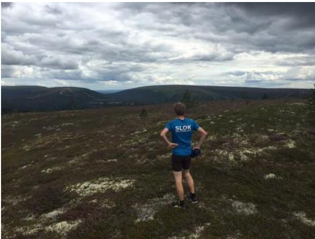
'Loslopen' op de 'rustdag'

Eens de 30 gepasseerd begint de aftakeling. Dag 1 goed en dan slechter en slechter. Het kan natuurlijk ook zo zijn dat het stilletjesaan gedaan is met te teren op de jaren van harde training en dat het dus terug tijd is van een beetje fatsoenlijk de trainingsmicrobe terug te vinden.